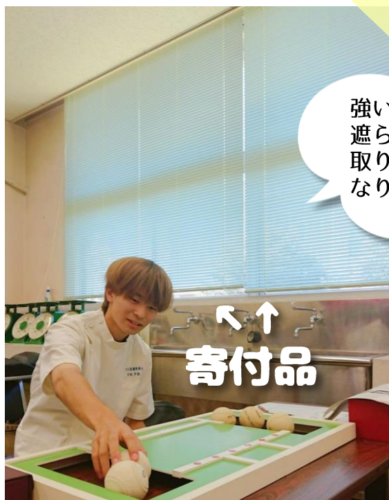
仁戸名キャンパスへ タチカワブラインド6枚を寄付