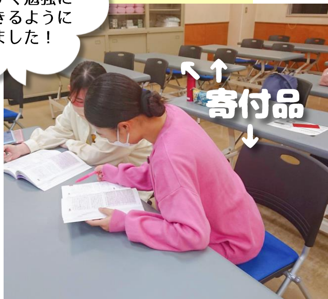
仁戸名キャンパスへ TOKIOネスティングチェア26脚を寄付