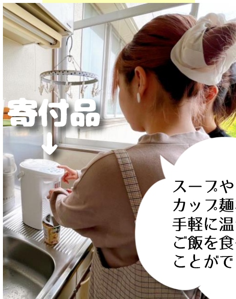
幕張キャンパスへタイガー魔法瓶 電気ポット2台を寄付