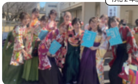
令和2年度 卒業の様子

後援会活動へのご意見・ご感想はこちらまで kouenkai2010@hotmail.co.jp