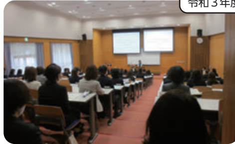
令和3年度 入学の様子