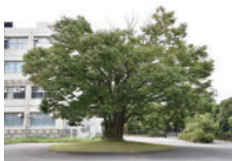
(上) 入口（西側）から見るとやや北側に傾いている (中) 南側から見ると葉よりも枝が多く見える (下) 複数本のケヤキをあわせて植栽されている